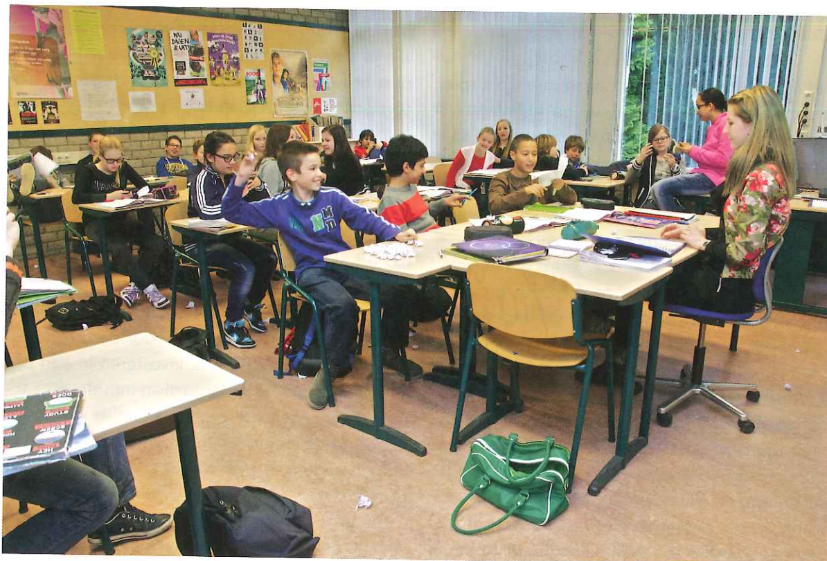
Figuur 9.4 Het is niet gemakkelijk om een negatieve groep om te buigen naar een positieve groep

In een negatieve groep is het voor kinderen moeilijker rustig en zelfstandig aan het werk te zijn. Als pedagogisch werker moet je in een negatieve groep vaker optreden als 'politieagent'. En zodra de meester of juf de klas uit is, loopt het mis en kan de groep niet zelfstandig aan het werk blijven. In een negatieve groep zijn de regels vaak onduidelijk en roepen de kinderen elkaar niet tot de orde.