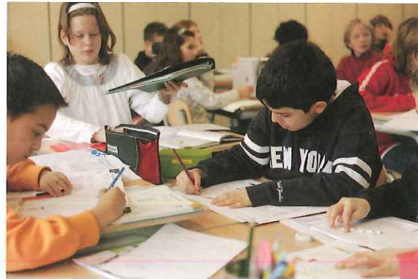
Figuur 9.1 In de klas zitten kinderen heel wat uren bij elkaar