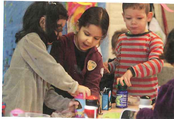
Figuur 9.7 Koppel kinderen aan elkaar om samen aan een taakje te werken