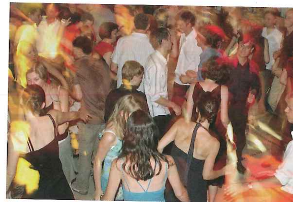
Figuur 9.6 Eindfeest van groep 8

Ze kunnen weer zichzelf zijn en komen niet meer in conflict met hun eigen waarden en normen. Ze zijn eindelijk verlost van de stress die een negatieve groep met zich meebrengt.