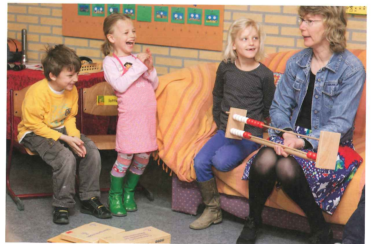
Figuur 9.2 In een positieve groep krijgen kinderen de ruimte om de rol te vervullen die bij ze past

De rol van de joker wordt al duidelijk uit zijn naam. Het is de grappenmaker die de spanning