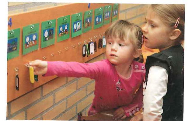
Figuur 9.5 Maatjes helpen elkaar

Juist deze beginfase is belangrijk voor jou als pedagogisch werker. Het is de periode waarin je de meeste invloed kunt uitoefenen op de sfeer in de groep. Als een groep eenmaal gevormd is, dan is het heel moeilijk om een negatieve groep om te buigen tot een positieve groep zonder iets te veranderen aan de samenstelling van de groep. Besteed de eerste weken van het schooljaar veel aandacht aan groepsvormende activiteiten en spelletjes die helpen bij het leren kennen van elkaar.